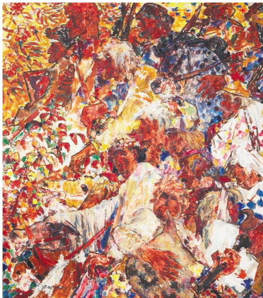
Fig. 4–5. Erik Haamers diptyk "Sigtunas erövrare" hänger i Estniska huset i Stockholm. Foto Jüri Soomägi